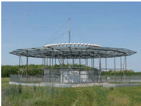
典型 VOR-NDB 地面發射站

現時全球劃一的系統叫甚高頻全向無線電信標導航系統 (VHF OMNIDIRECTIONAL RANGE, VOR)，發射電台向三百六十度