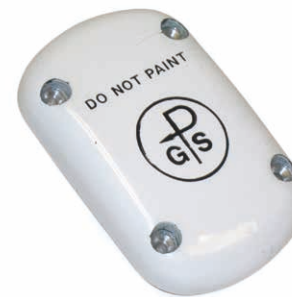
飛機機身上之 GPS 天線

既已談到軍用系統，不妨再看一下目前尖端導航技術，最近，在俄羅斯於敘利亞展開軍事行動之新聞報導中，便出現了巡航導彈 (CRUISE MISSILE)，它其實是種無人駕駛噴射機，可裝上各種彈頭迂迴潛入敵陣進行高精度攻擊，採用數碼地圖記憶對照及目標照片記憶對照法，飛行二千五百公里後落地點誤差可低至五米，換句話說，可在香港大球場的十二碼點，一腳把球「踢」入南韓首爾世界盃競技場的龍門內！