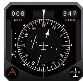
飛機駕駛艙內之 VOR-DME-ADF 綜合顯示儀

現時 HF 這個優點卻主要被用於航海而不是航空通訊，航空通訊選用 VHF，原因是不能容許天氣及電離層變化帶來之影響，而更重要的是它的頻率由 30MHz - 300MHz，寬 270MHz，比 HF 寬 10 倍，在無線電頻譜 (SPECTRUM) 日益擠逼的今天，實在非常有利。現時普遍用 108MHz 以上通訊，即剛在 FM 廣播 88-108MHz 旁邊。至於長程越洋飛機，則輔以 HF 或衛星通訊。