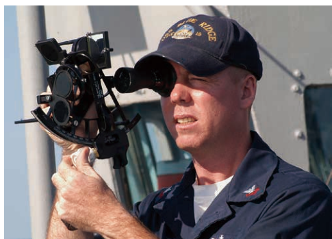
一位海員正操作六分儀

一九零三年，動力飛行成功，飛行家們自然承襲了上述的方法，但裝在飛機上的磁羅盤，搖擺得比在船上更甚，至於六分儀，由於操作麻煩，機師在飛行中實在無法分神兼顧。當時的飛行家與古代的航海家一樣，靠的主要還是運氣。