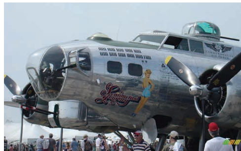
Boeing B17 遠程戰略轟炸機，留意位於駕駛員前方，作天文導航用之觀星圓頂

把航海家從感性的觸覺推向理性的思維是磁羅盤及六分儀 (SEXTANT) 的發展。磁羅盤在一一八零年傳入歐洲，十四世紀航海冒險事業漸達顛峰，它更得到廣泛使用，但由於很易受船上鐵器及海浪影響，故在航海家心目中，亙古不變的天體才是在瞬息萬變的驚濤駭浪中航行時最值得信賴的伙伴。以六分儀測出特定天體的高度後，以當時時間對照天文年曆便可在海圖上定位，這種天文航行法 (CELESTIAL